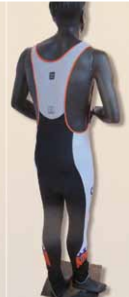
Hose lang (Winter)

Wir Fachleute Betriebsunterhalt sind meistens die Ersten wenn es irgendwo im Betrieb „brennt“. Ein Wasserschaden, eine kaputte Lampe, eine Tür die klemmt, usw. Wir sind sofort zur Stelle um den Schaden zu beheben und sorgen dafür, dass es im Betrieb wieder rund läuft. Darauf sind wir stolz, nicht nur während der Arbeit sondern auch in unserer Freizeit!