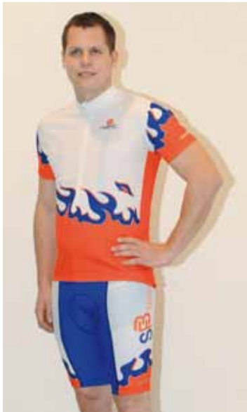
Hose kurz mit Shirt

Möchten Sie zukünftig mit SFB-Tricots richtig feurig auf dem Velo daherkommen?