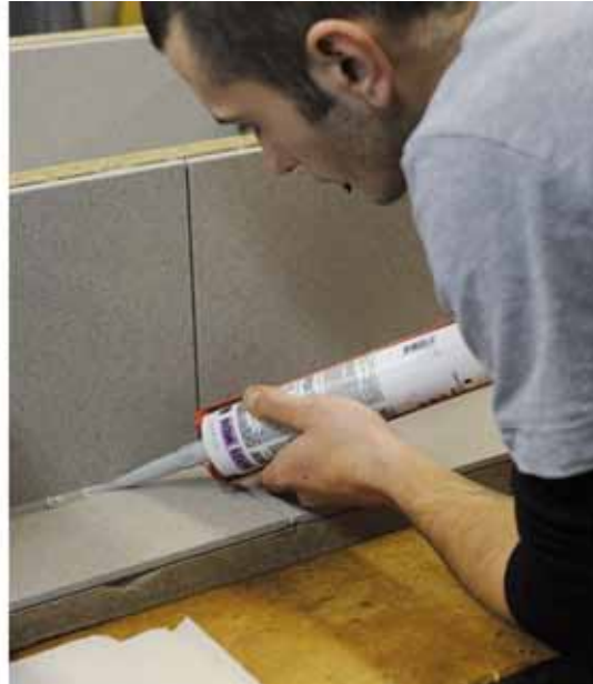
Für das Fugenkitten braucht es eine ruhige Hand.