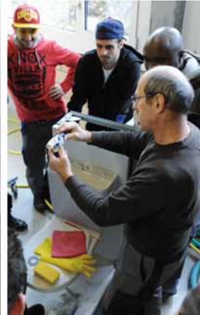
So stellt man die optimale Wassermenge ein.

Am Arbeitsposten Lüftungsanlage wird in Gruppenarbeit nach Checkliste die Funktion der Lüftung überprüft und der Keilriemen zwischen Motor und Turbine gespannt. Die nächste Arbeitsstation ist eine Repetitionsübung. In Zweiergruppen grundreinigen die Lernenden mit der Methode der Sprühextraktion einen textilen Bodenbelag. Als letzte Aufgabe des Tages steht ein Abschlusstest im Multiple Choice Verfahren über alle überbetrieblichen Kurse an. Am Ende werden die Lösungen besprochen und letzte Wissenslücken gefüllt.